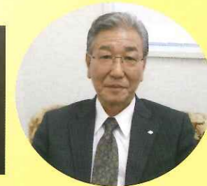
ダンディな 岩田社長