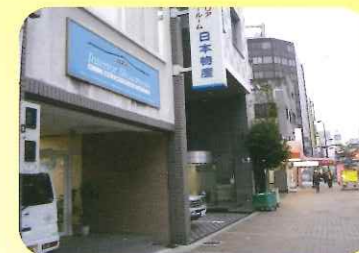
三宮の大通り沿いにある本社