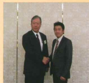
りそな銀行 廣富副社長