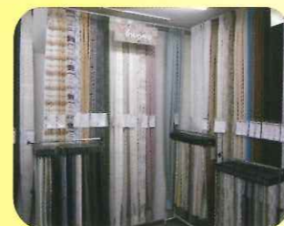
豊富な品揃えのインテリア用品

三宮の中心地に本社を構える室内装飾・リフォームの総合商社で、今年3月に創業95周年を迎える老舗商社です。最近ではリフォーム事業に力を入れているということで、日本の大手メーカーの商品を取り扱い、完全オーダー制でプロ職人がリフォーム全般にいてお手伝い