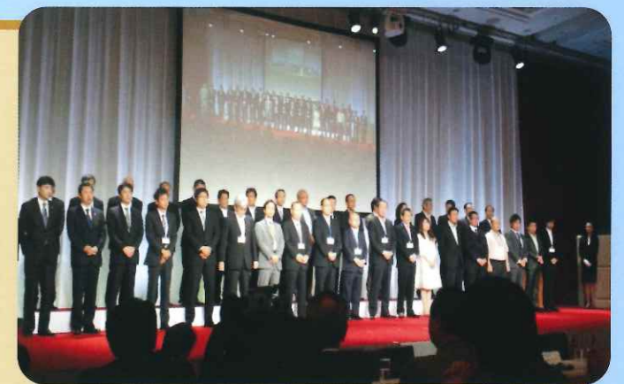
表彰式の様子です

懇親会の場などで、いろいろな代理店の方と話をし、非常に参考になるお話ができました。